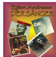
Der Sänger 2001 (Single)

Björn Andresen Herr Jedermann von nebenan