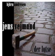
Jens Vejmand – Der Lotse 2005,2006 (Single)