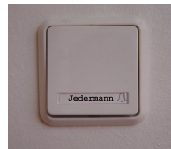
Herr Jedermann von nebenan 2006 (Single)

Björn Andresen Herr Jedermann von nebenan