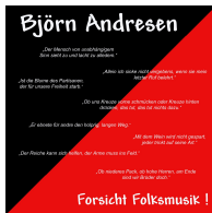
Forsicht Folkmusik ! 2006